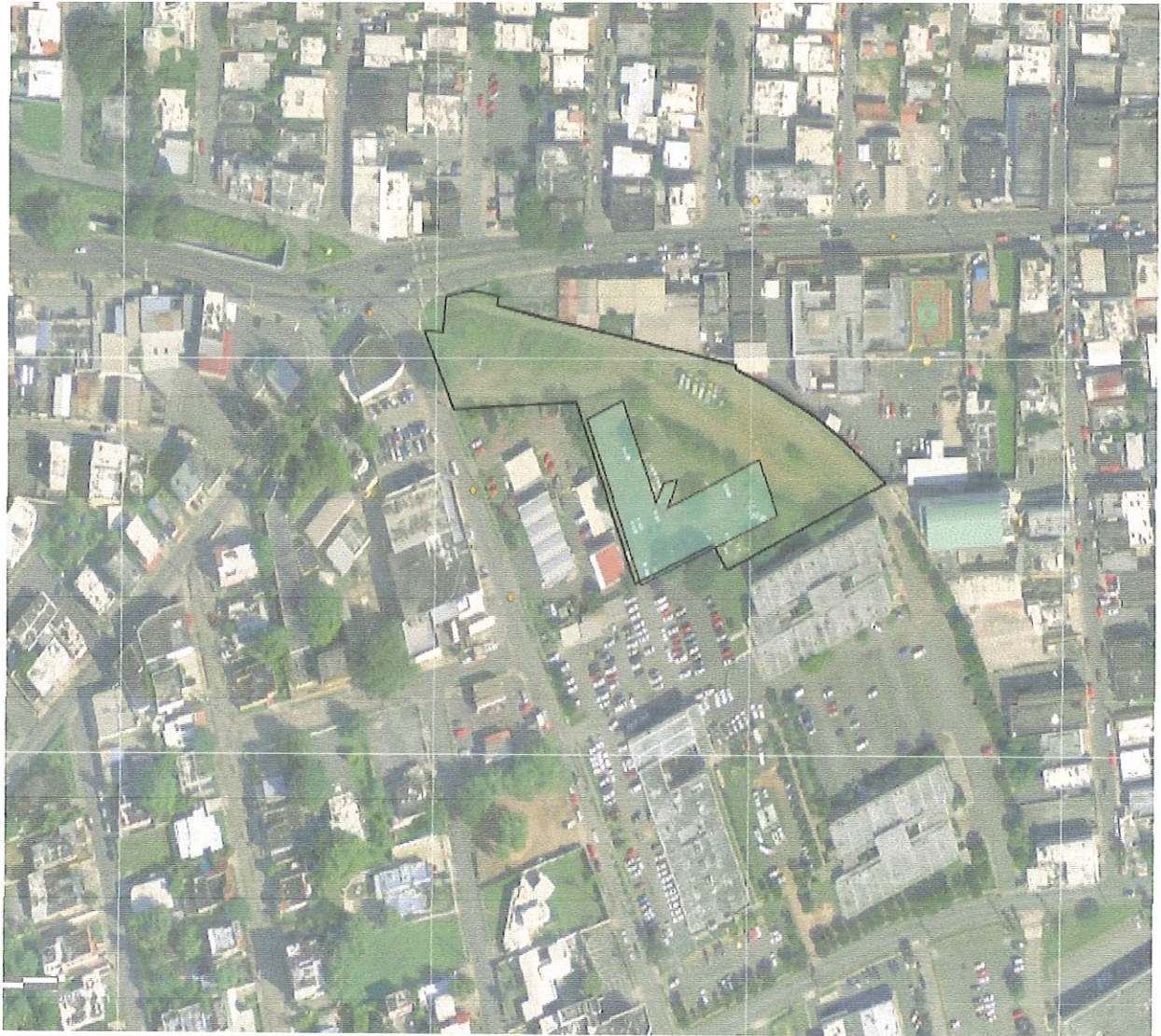
Figura #2 - Esquemático